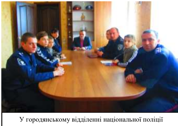
У городнянському відділенні національної поліції