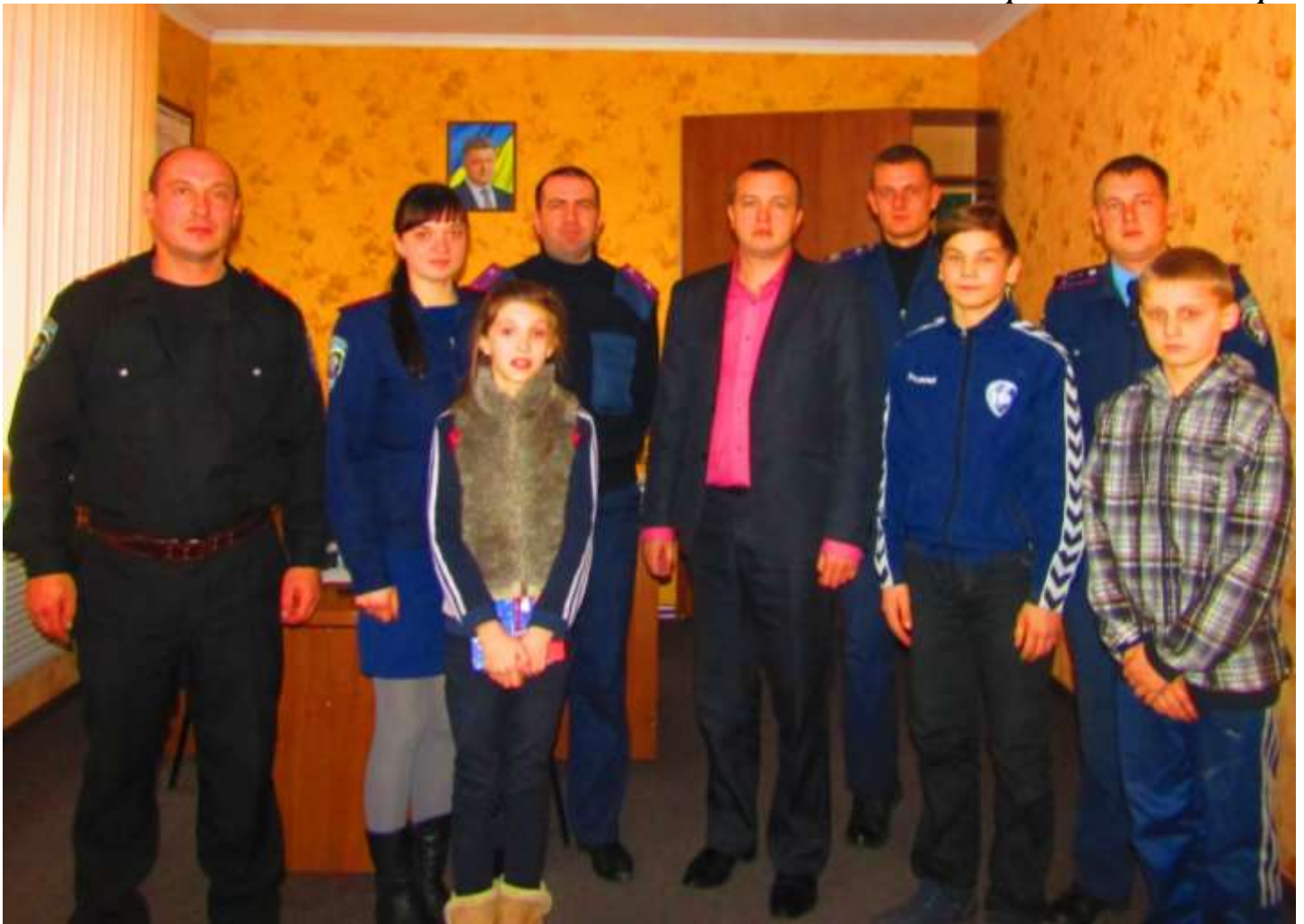
Світлина на згадку